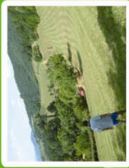
Salaš Dragana Đorđevića Telefon 012/69 102